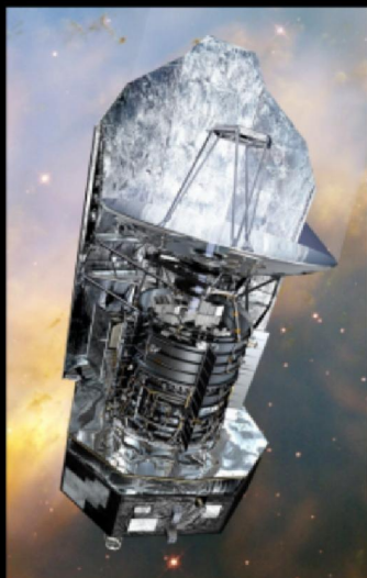
Herschel satelliet met supergeleiding